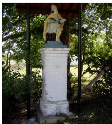
Socha svätého Urbana

Socha sa nachádza pri rieke Nitra, v blízkosti mosta.