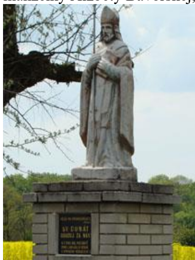
Socha svätého Donáta