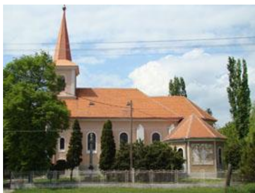
Rímskokatolícky kostol z r.1892

Pomník je venovaný padlým bojovníkov v druhej svetovej vojne v rokoch 1940 – 1945 a je umiestnený v parčíku vedľa cintorína v Dolnom Vinodole.