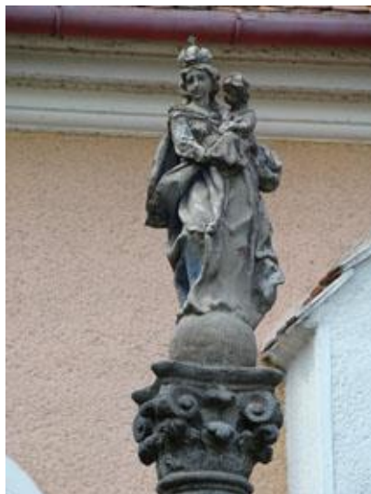
Mariánsky barokový stĺp