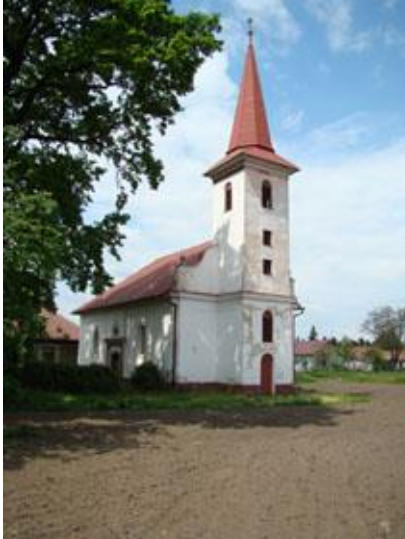
Kostol reformovanej kresťanskej cirkvi

Počiatky stavebného vývoja kostola Reformovanej kresťanskej cirkvi, ľudovo nazývanej kalvínskej, siahajú do roku 1790. Počas svojej existencie bol prestavaný, predovšetkým však v roku 1876, kedy bola ku kostolu pristavaná veža. Exteriér kostola je členený lizénovým rámovaním.