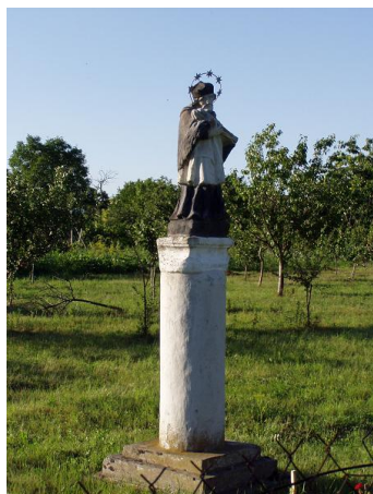
Socha svätého Jána Nepomuckého