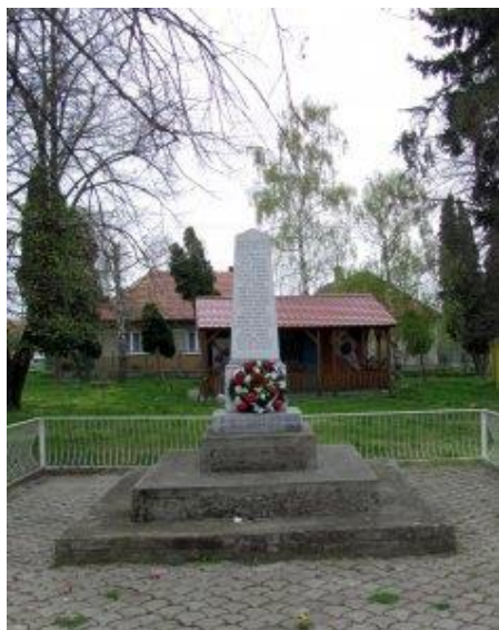
Pomník obetiam 2. svetovej vojny

Pomník je venovaný padlým bojovníkov v druhej svetovej vojne v rokoch 1940 – 1945 a je umiestnený v parčíku vedľa cintorína v Dolnom Vinodole.