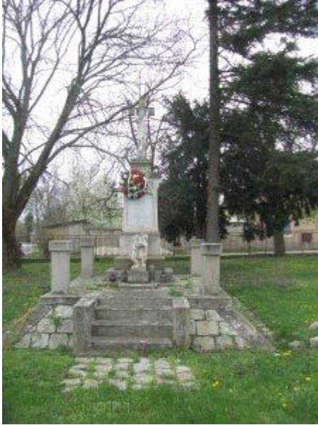
Pomník Obetiam 1. a 2 svetovej vojny

Pomník sa nachádza v Hornom Vinodole, bol venovaný vdovami po padlých.