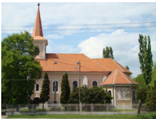
Rímskokatolícky kostol z r.1892