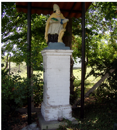
Socha svätého Urbana

Socha svätého Urbana, patróna vinohradníkov, je umiestnená v severovýchodnej časti obce, vo viniciach. Pri soche sv. Urbana vo viniciach, sa každoročne uskutočňuje svätá omša.