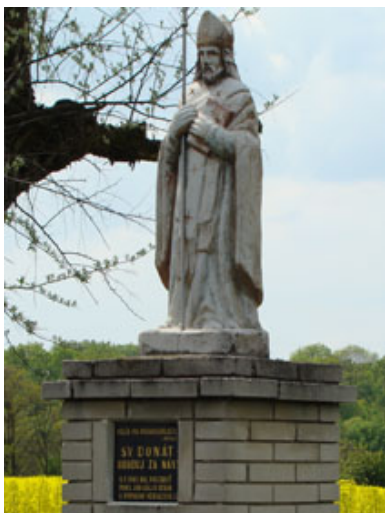
Socha svätého Donáta