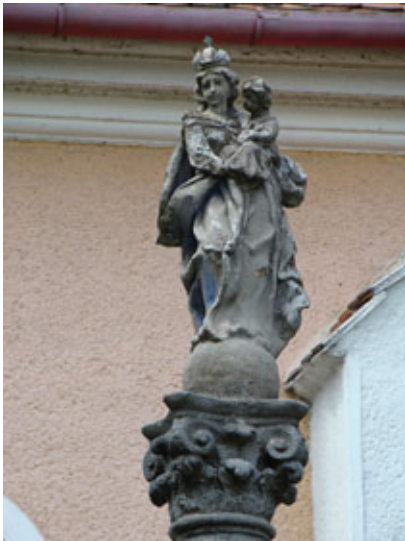
Mariánsky barokový stĺp