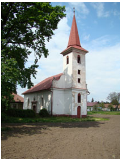
Kostol reformovanej kresťanskej cirkvi

Počiatky stavebného vývoja kostola Reformovanej kresťanskej cirkvi, ľudovo nazývanej kalvínskej, siahajú do roku 1790. Počas svojej existencie bol prestavaný, predovšetkým však v roku 1876, kedy bola ku kostolu pristavaná veža. Exteriér kostola je členený lizénovým rámovaním.