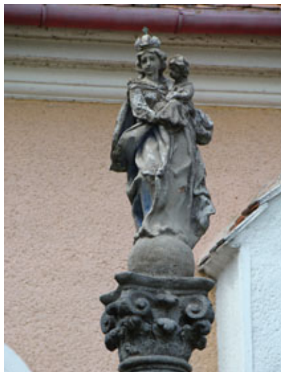
Mariánsky barokový stĺp