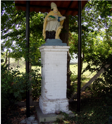
Socha svätého Urbana

Socha svätého Urbana, patróna vinohradníkov, je umiestnená v severovýchodnej časti obce, vo viniciach. Pri soche sv. Urbana vo viniciach, sa každoročne uskutočňuje svätá omša.