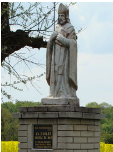
Socha svätého Donáta