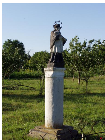
Socha svätého Jána Nepomuckého