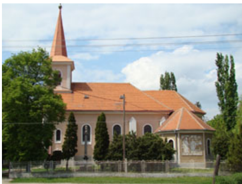
Rímskokatolícky kostol z r.1892