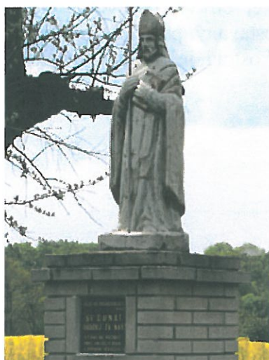
Socha svätého Donáta