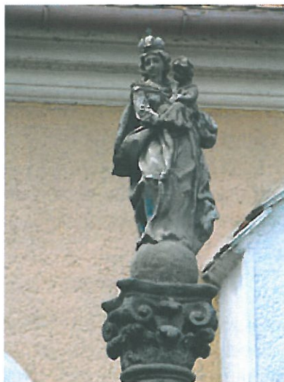
Mariánsky barokový stĺp