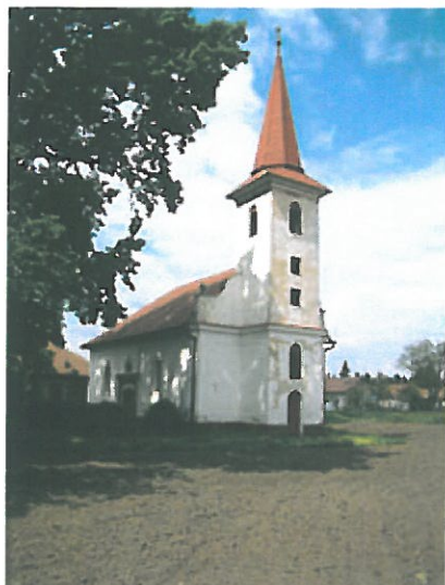
Kostol reformovanej kresťanskej cirkvi

Počiatky stavebného vývoja kostola Reformovanej kresťanskej cirkvi, ľudovo nazývanej kalvínskej, siahajú do roku 1790. Počas svojej existencie bol prestavaný, predovšetkým však v roku 1876, kedy bola ku kostolu pristavaná veža. Exteriér kostola je členený lizénovým rámovaním.