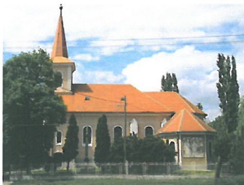
Rímskokatolícky kostol z r.1892