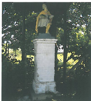
Socha svätého Urbana

Socha svätého Urbana, patróna vinohradníkov, je umiestnená v severovýchodnej časti obce, vo viniciach. Pri soche sv. Urbana vo viniciach, sa každoročne uskutočňuje svätá omša.