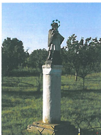
Socha svätého Jána Nepomuckého